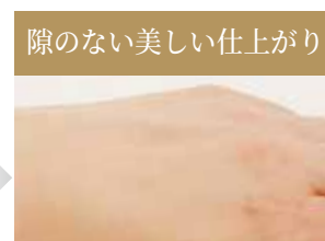
自然でツヤ感のある美しい仕上がり