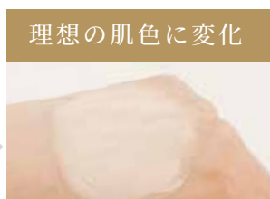
軽く馴染ませると3色のカラーカプセルがはじけて新鮮な肌色を発色