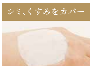
白色クリームがシミやくすみ、肌の色ムラをカバー